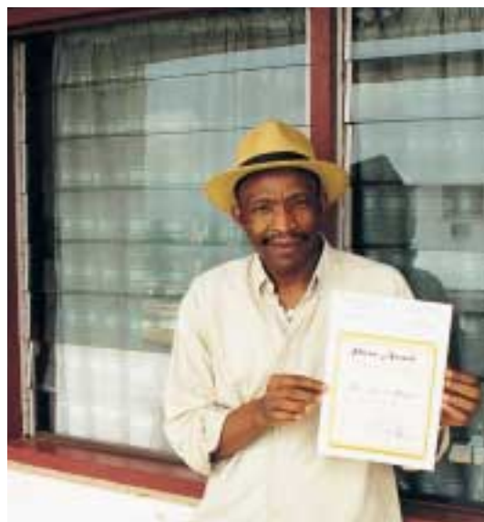
En 1999, le prix du meilleur journal du Cameroun a été décerné à La Voix du Paysan

La ligne éditoriale est néanmoins fortement engagée. En témoigne ce titre d'article récent : « Importation des denrées alimentaires : une catastrophe