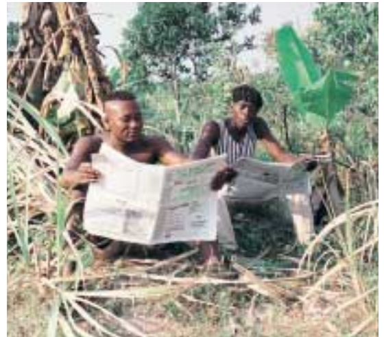
Des lecteurs de La Voix du Paysan lors d'une pause au travail

Enfin, des journées d'information thématiques sont organisées par le centre de documentation du SAILD (Service d'appui aux initiatives locales de développement), l'ONG qui sert de structure au journal. La dernière manifestation a porté sur la culture du champignon.