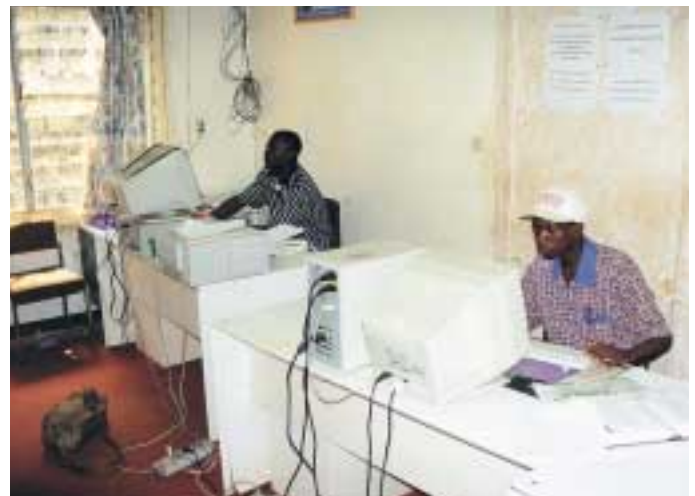
Les journalistes de La Voix du Paysan travaillent au prochain numéro du journal dans les bureaux de Douala (Cameroun)