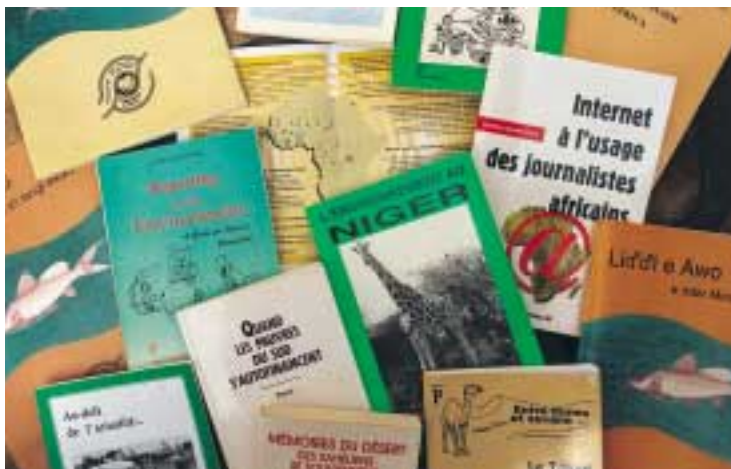
Quelques exemples de brochures de Panos consacrées à l'environnement et à la communication

Panos a également subventionné la production de manuels scolaires sur l'environnement dans plusieurs pays et en particulier au Niger et au Tchad, deux États particulièrement affectés par la désertification. Panos a fourni aux journalistes des équipements de reportage et a financé leurs frais de déplacement pour leur permettre de se rendre dans les zones sensibles et y effectuer des reportages ou y mener des enquêtes. Pour s'assurer que ces appuis iraient bien aux journalistes eux-mêmes, les subventions furent divisées en deux parties : l'une était destinée aux responsables des médias et l'autre aux journalistes qui devaient faire parvenir à Panos des copies de leurs articles ou de leurs émissions de radio pour prouver la réalité de leurs prestations.