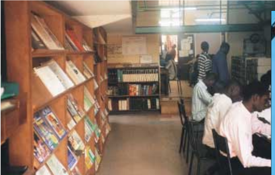
En haut : la bibliothèque du CESAO est un lieu très fréquenté