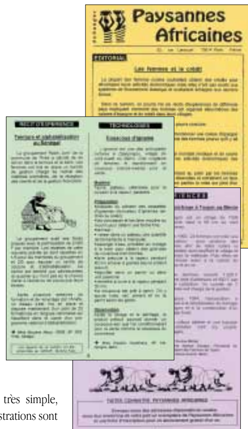
Quelques numéros du bulletin Paysannes Africaines