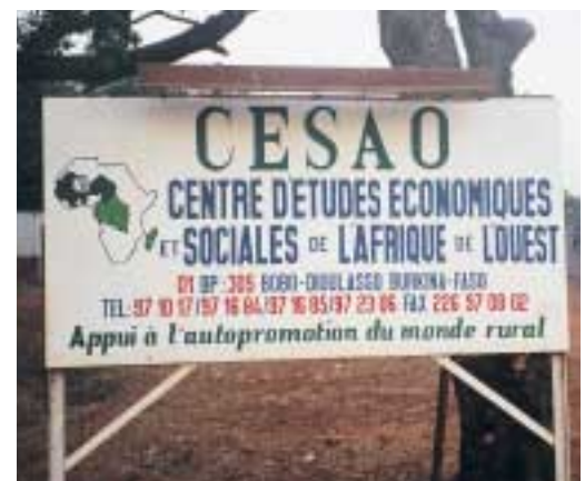
Le siège du CESAO à Bobo-Dioulasso, Burkina Faso

De nouvelles perspectives sont ouvertes pour Paysannes Africaines grâce au partenariat qui a été conclu avec le Centre d'études économiques et sociales d'Afrique de l'Ouest (CESAO), basé à Bobo-Dioulasso, au Burkina Faso (voir encadré 7). Dans le cadre de ces