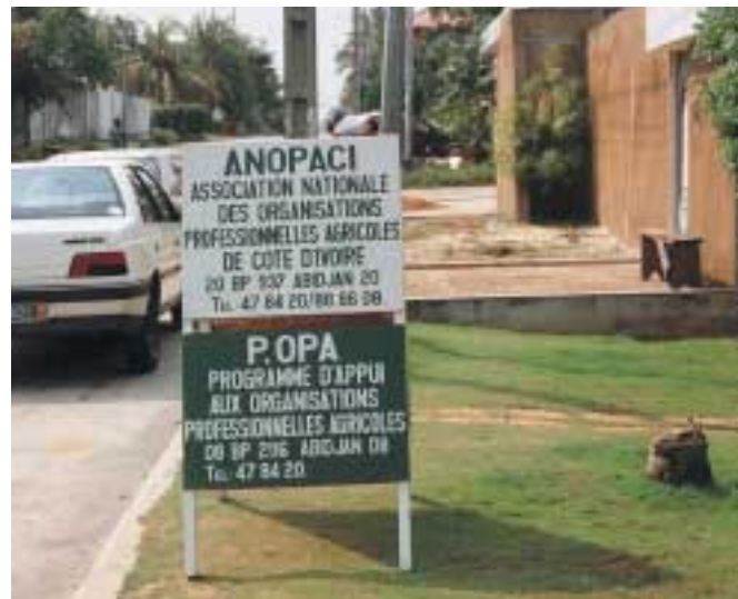
Devant les bureaux de l'ANOPACI à Abidjan (Côte d'Ivoire)